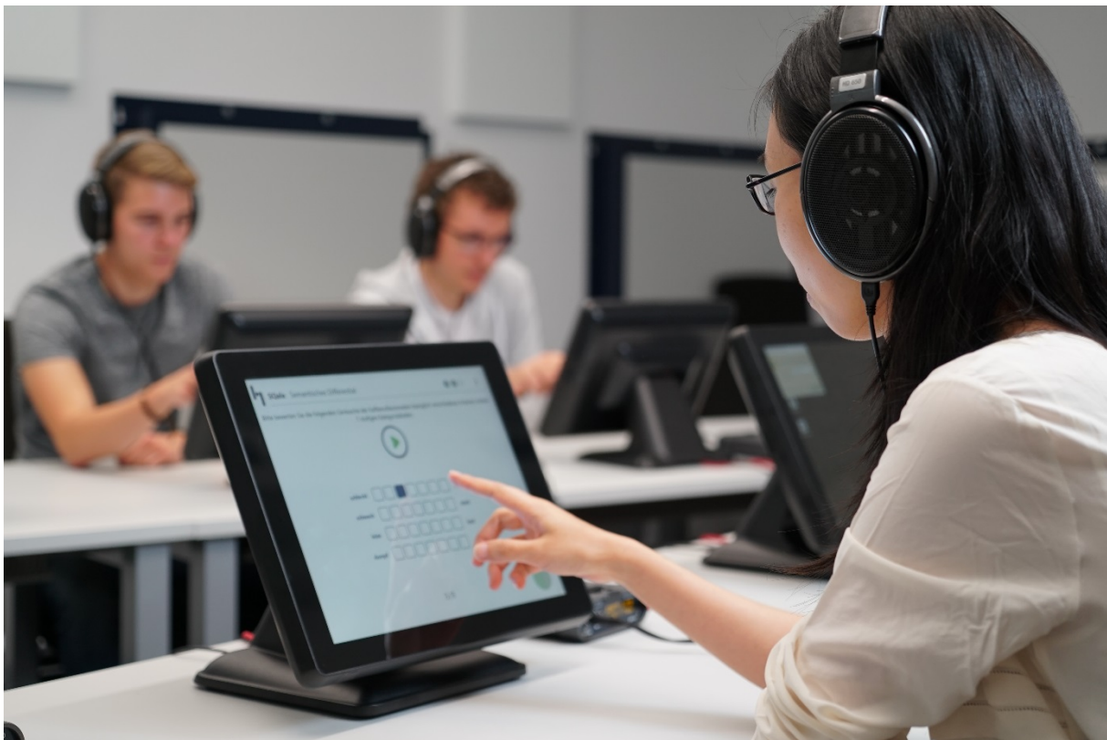
Hörversuch mit SQala in ArtemiS SUITE 10.0.