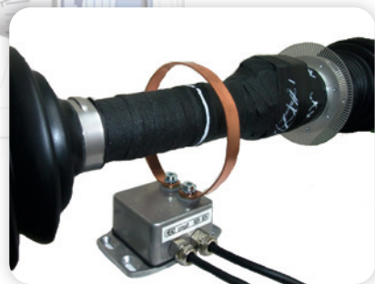
Sensoren für Drehzahl und Drehmoment an einer Antriebswelle